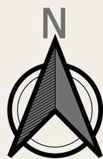
Схема інженерного забезпечення території М 1:1000